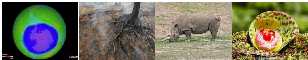
Озонова дупка, киселинни дъждове, изчезнали и застаршени видове от дейността на човека