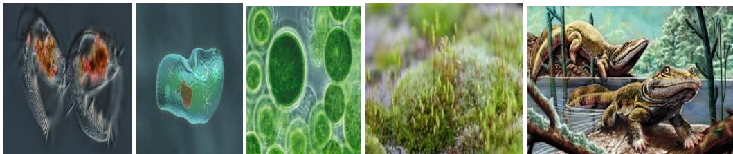
Еволюция на организмите